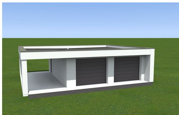
Garage for two cars covered with a flat roof with an additional position in the carport.