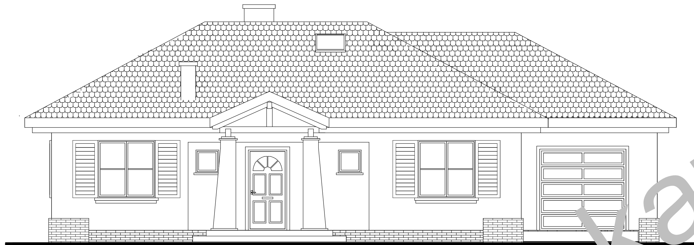
elewacja frontowa :