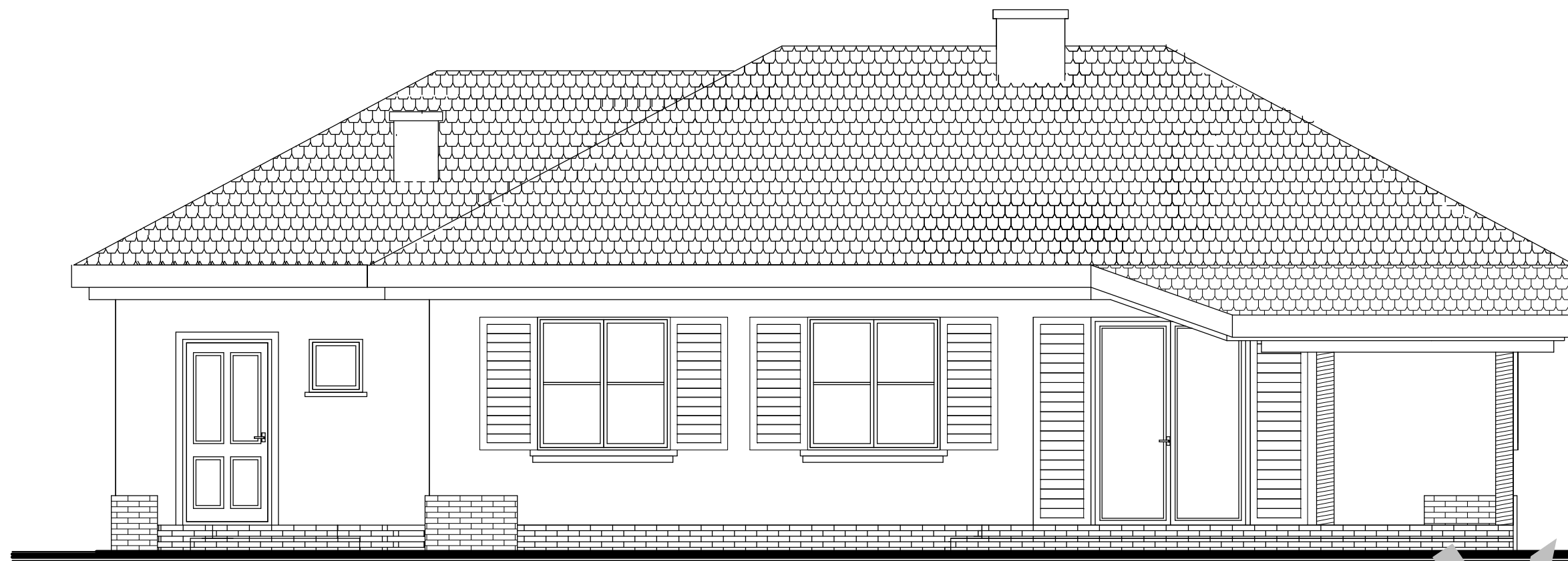
elewacja ogrodowa :