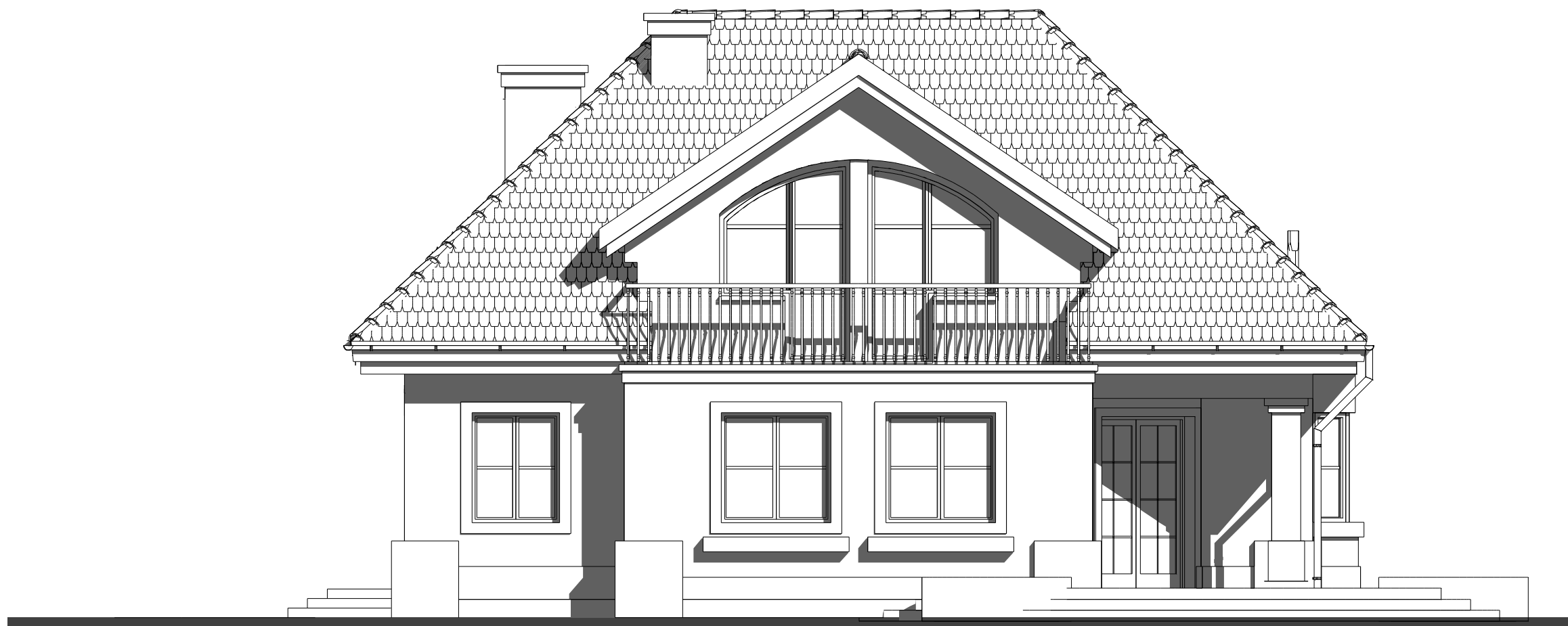
elewacja tylna ( ogrodowa ) :