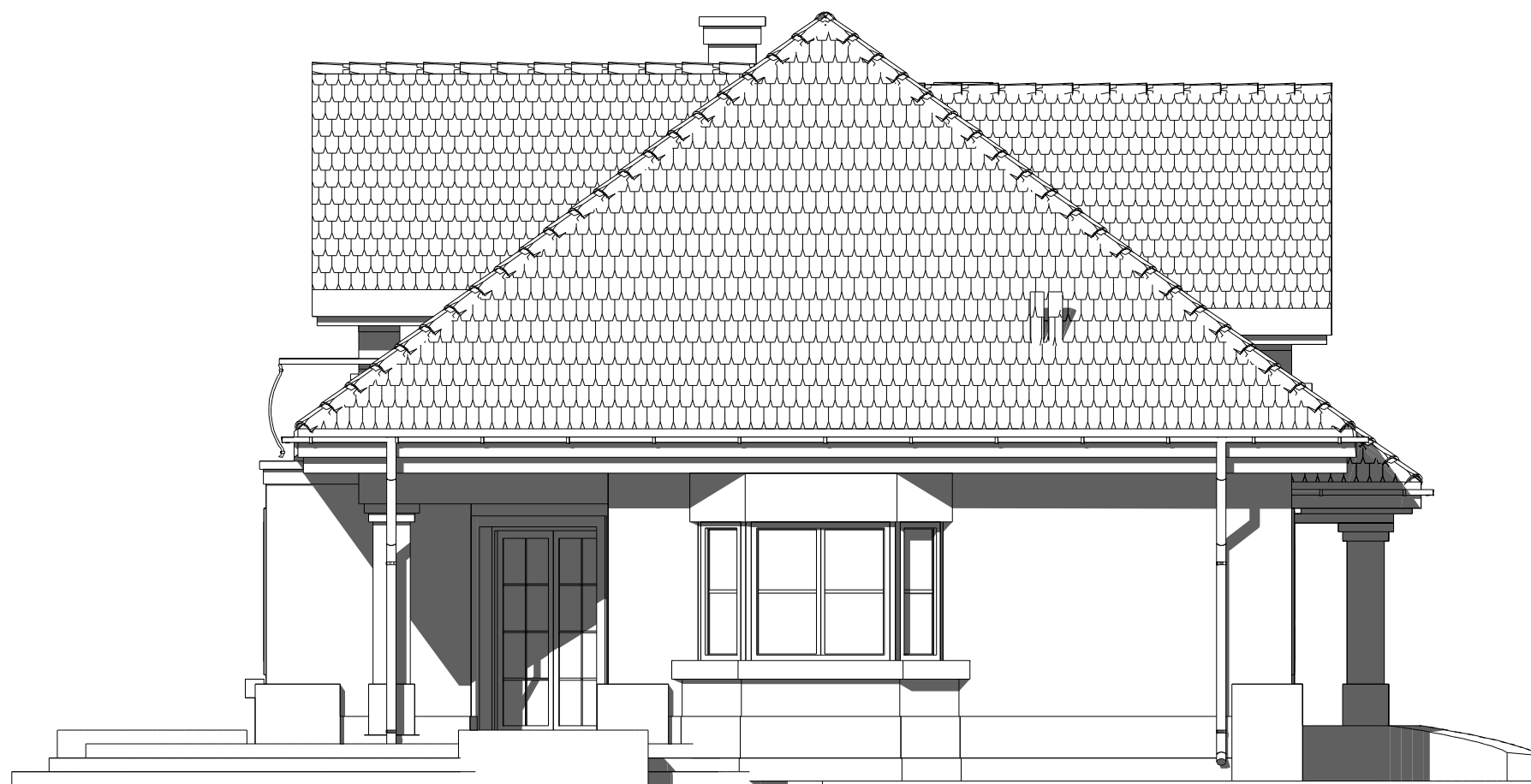
elewacja boczna :