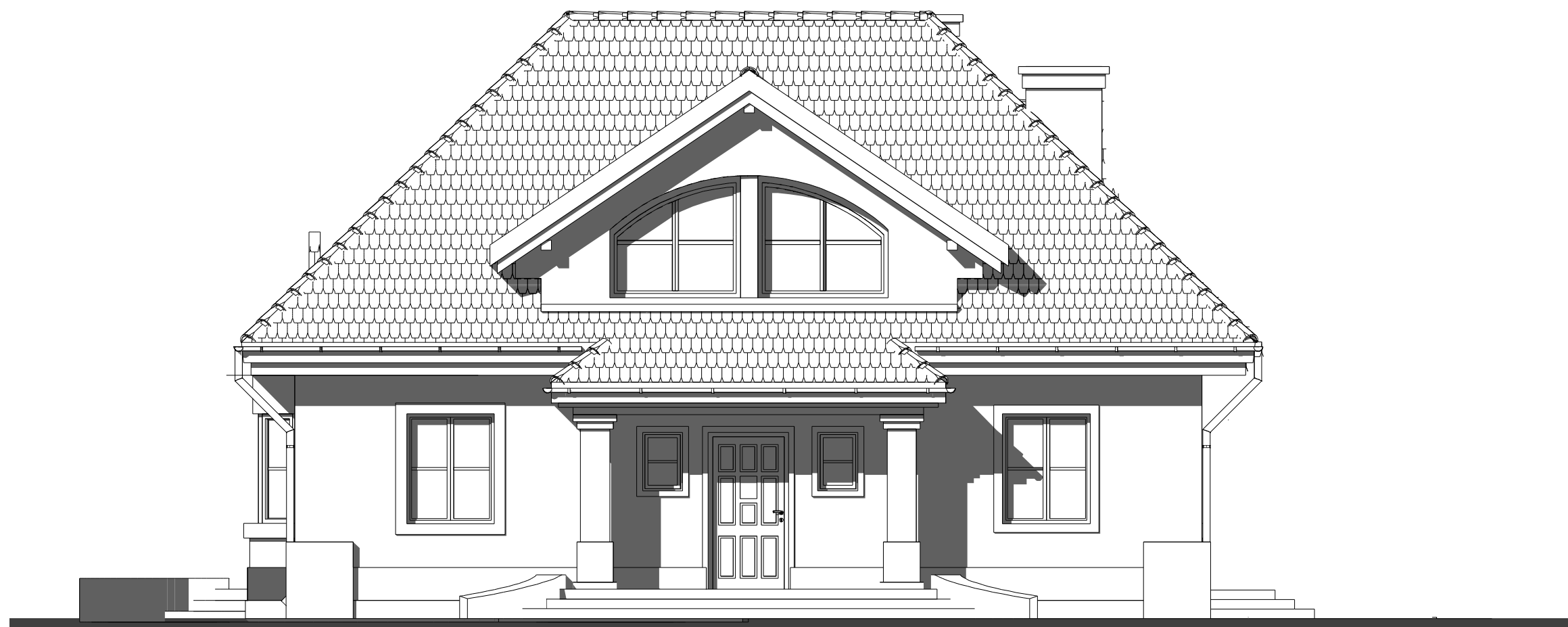
elewacja frontowa :