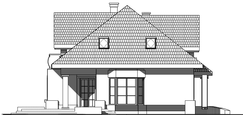
elewacja boczna :