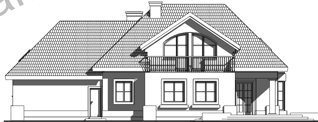
elewacja tylna ( ogrodowa ) :