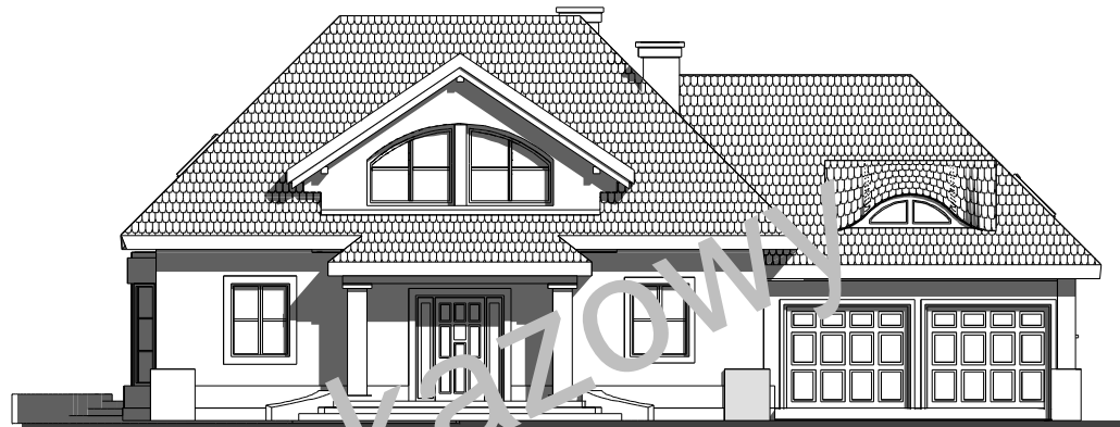
elewacja frontowa :