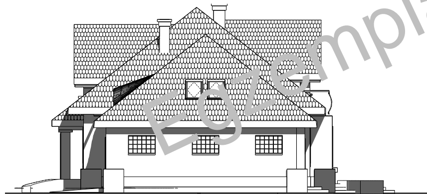
elewacja boczna :