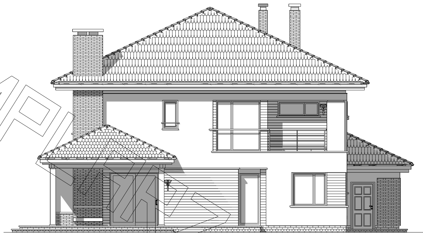
elewacja ogrodowa : elewacja boczna :